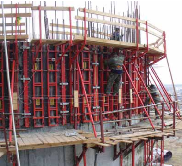
Будівництво цементного заводу